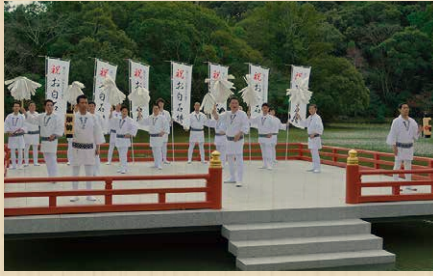
三重県伊勢市 伊勢神宮奉仕会青年部 【いせじんぐうほうしかいせいねんぶ】