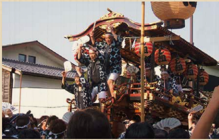
新潟県新発田市 新発田市台輪連絡協議会 【しばたしだいわれんらくきょうぎかい】