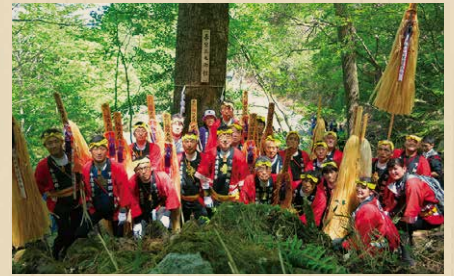
長野県下諏訪町 下諏訪町木遣保存会 【しもすわまちきやりぼんかい】