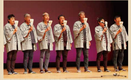
長野県長野市 善光寺木遣り保存会 【ぜんこうじきやりぼんかい】