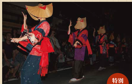
秋田県羽後町 西馬音内盆踊り愛好会 【にしもないぼんおどりあいこうかい】