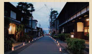
中山道 立町通り 長野県諏訪郡下諏訪町立町