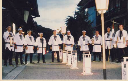
長野県木曽町 木曽木遣り筏衆 【きそきやりいかだしゅう】