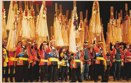
長野県諏訪地域 諏訪地域木遣保存会 【すわちいききやりぼんかい】