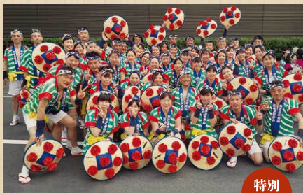
山形県 山形花笠踊り 民俗文化サークル四方山会 【みんぞくぶんかさーくるよもやまかい】