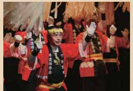
下諏訪町木遣保存会