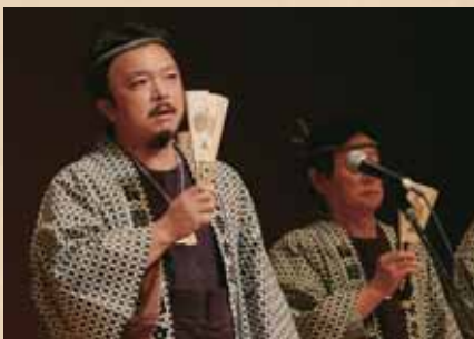
善光寺木遣り保存会