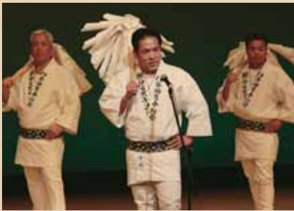
伊勢神宮奉仕会青年部