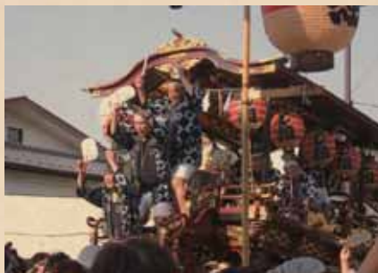
新発田四之町し組会