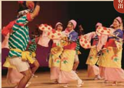
山形花笠踊り 民俗文化サークル四方山会